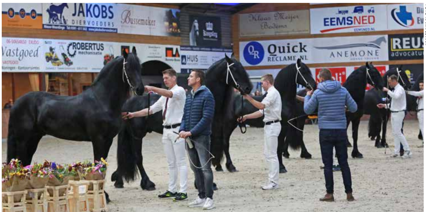
Sechs Hengsten legten mit gutem Erfolg die Hengstleistungsprüfung ab und empfangen ihren Deckschein.

Martzen 521 (Dries 421 x Abe 346) Alger 522 (Haike 482 x Wylster 463) Faust 523 (Maurits 437 x Haitse 425)