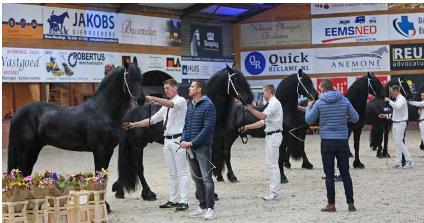
Zes hengsten legden met goed gevolg het Centraal Onderzoek af en ontvingen hun dekbevet.